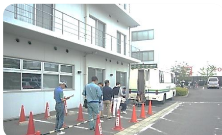
本所駐車場でのレントゲン健診