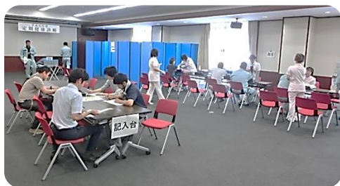
本所 4 階ホールでの健康診断