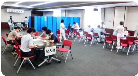
本所 4 階ホールでの健康診断