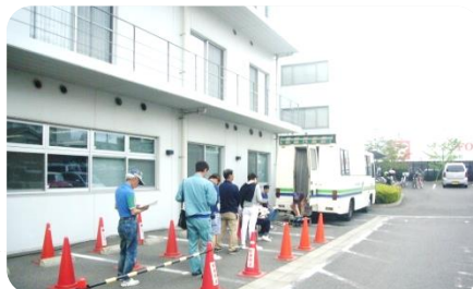
本所駐車場でのレントゲン検診