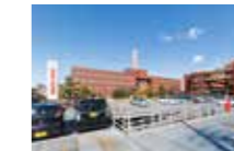
阪和第二泉北病院

阪和インテリジェント医療センターは錦秀会グループの病院をはじめ、多くの専門医療機関と連携し、万全の体制でフォローいたします。