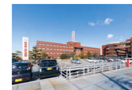
阪和第二泉北病院

万一の異常所見があればご希望の医療機関もしくは連携先の医療機関などにスピーディーに紹介いたします。阪和インテリジェント医療センターは錦秀会グループの病院をはじめ、多くの専門医療機関と連携し、万全の体制でフォローいたします。