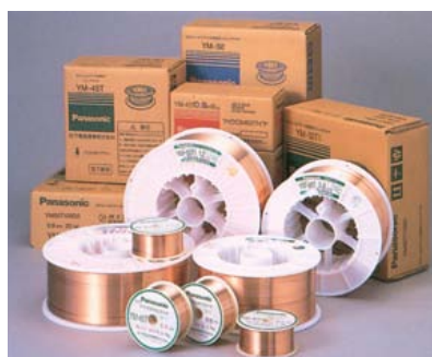
溶接用ソリッドワイヤ(スプール)