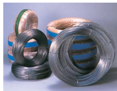
釣針素線用高炭素鋼線