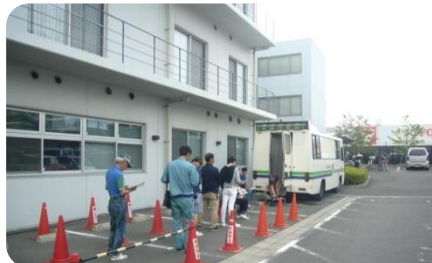
本所駐車場でのレントゲン健診