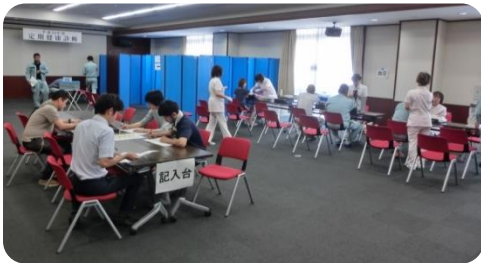
本所 4 階ホールでの健康診断