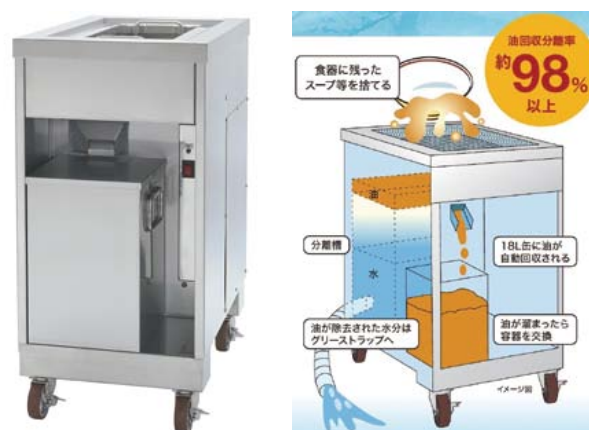
グリスセパレーション

グリーストラップの汚水を一旦製品内に吸上げて油脂分を除去（回収）し水分のみをグリーストラップへ排水します。除去（回収）した油脂は不純物が少なくリサイクル可能です。