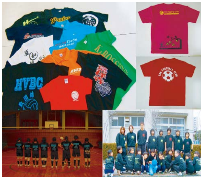
オリジナルTシャツ