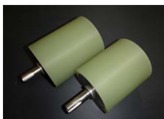
ウレタンゴムローラー