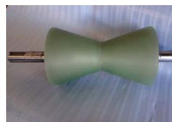
生産ライン用 V型ロール