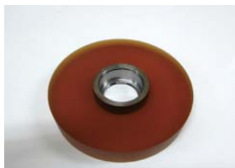
超耐摩耗ウレタンゴムローラー