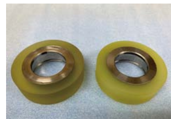
導電性ウレタンゴムローラー