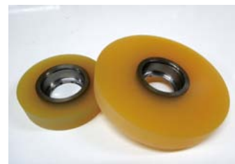
耐熱性ウレタンゴムローラー